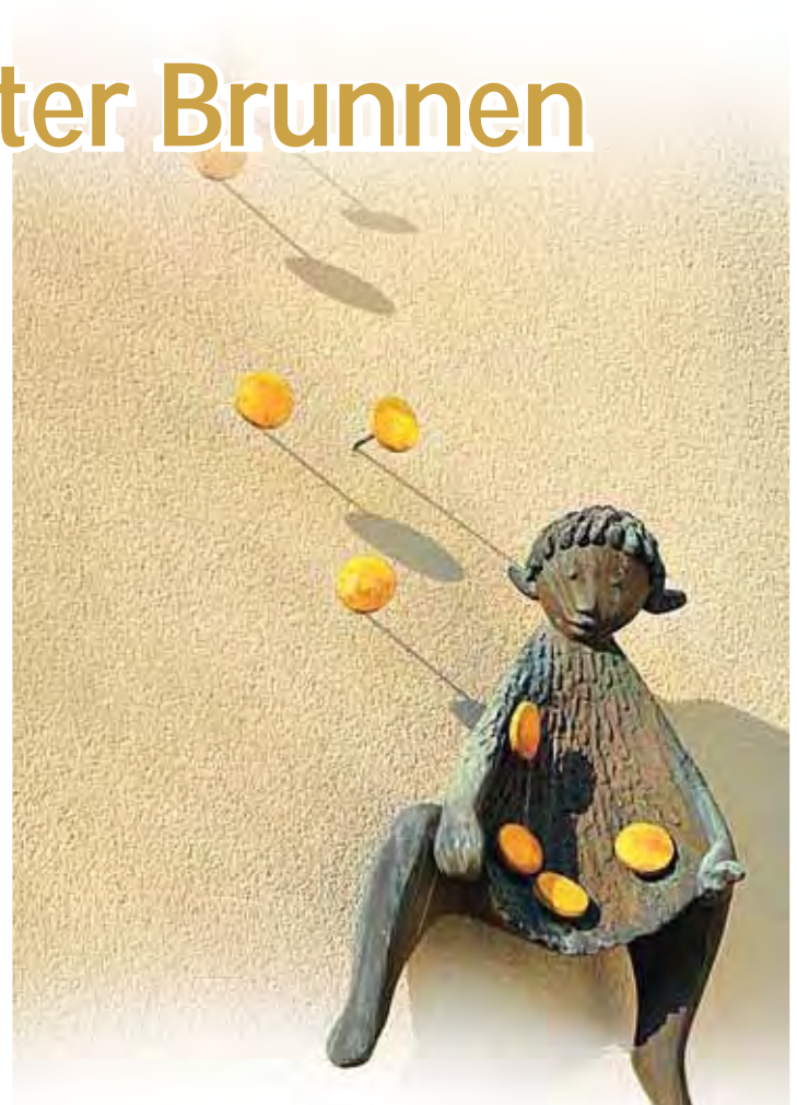
Märchenskulptur „Sterntaler-mädchen“

Wegen der Gesundheits- und Hygienevorschriften sowie der damit verbundenen aufwändigen Kontrollen wurde dieser preiswerte Wasserbezug eingestellt. Das Quellwasser wird seitdem direkt in die Kanalisation des