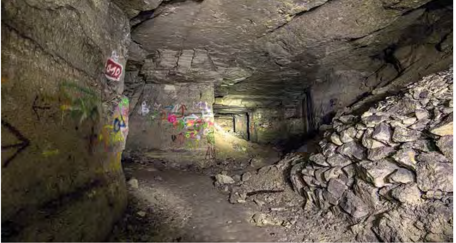
Gewaltiges Labyrinth in über 100 Meter dicken Ascheschichten – die Königswinterer Ofenkaulen

stellung von Pumpnickel besonders gern Königswinterer Tuff. Mit dem Aufkommen von gas- und strombetriebenen Öfen verlor das Gewerbe in der Mitte des 20. Jahrhunderts an Bedeutung.