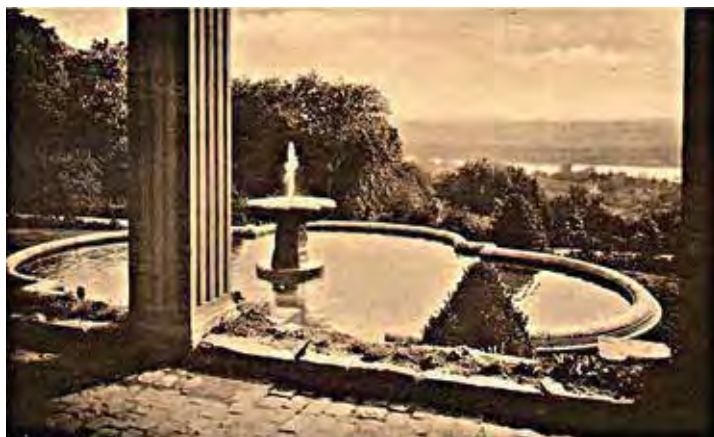
Eine prächtige Gartenlandschaft mit Springbrunnen zierte Haus Heisterberg

Satteldach im Eingangsbereich wurde später, 1892, zwei Jahre vor dem Tod des Patrons, noch ein imposanter Turm aufgesetzt. Der Königlich-Preußische Gartenbaudirektor Joseph Clemens Weyhe aus Düsseldorf erhielt den Auftrag für das Drumherum der neuen Villa. Auf dem Areal legte er große Parkanlagen an, auf dem Hangrücken oberhalb des Schösschens gestaltete er sie als Landschaftsgarten, quasi als begehbares Gemälde, bei dem Pflanzen und Bäume sowie architektonische Elemente die Arbeit des Pinsels ersetzen. Das Wasser eines Teiches bot die Spiegelfläche für die Pracht. Er befand sich auf der Wiese vor dem mehr als zehn Meter hohen Aussichtsturm. Als der Park entstand, gehörte solch ein romantisches Mauerwerk unbedingt dazu. Sehenswert ist dieser neogotische Burgturm mit dem Spitzbogen über der Tür noch immer. Auf ihm die Inschrift: „Fest steht und treu die Wacht, die Wacht am Rhein!“ Das Wappen mit der Jahreszahl 1871 erklärt den Sinn: