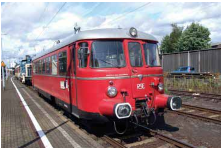
MAN VT 25 der Rhein-Sieg-Eisenbahn im Bahnhof Bonn-Beuel

Am Anfang stand die Ausbeutung der Bodenschätze in unserer und angrenzenden Regionen, die satte Gewinne versprach. Doch der Abtransport der wertvollen Güter bereitete den Verantwortlichen anfänglich Kopfzerbrechen. Das war die Geburtsstunde der Rhein-Sieg-Eisenbahn, kurz RSE genannt. Heute kennt man die RSE Rhein-Sieg-Eisenbahn GmbH als ein mittelständisches Eisenbahnverkehrs- und Eisenbahninfrastrukturunternehmen des öffentlichen Verkehrs mit Sitz in Bonn. Deren Geschichte ist