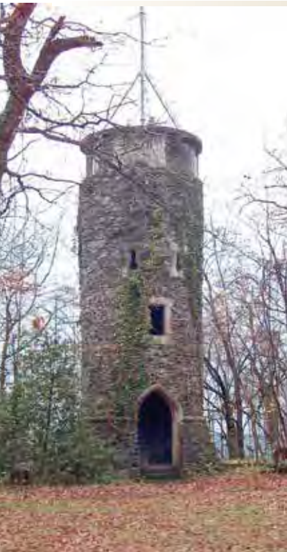
Der Aussichtsturm von Haus Heisterberg steht heute auf dem Gelände des JUFA-Hotels