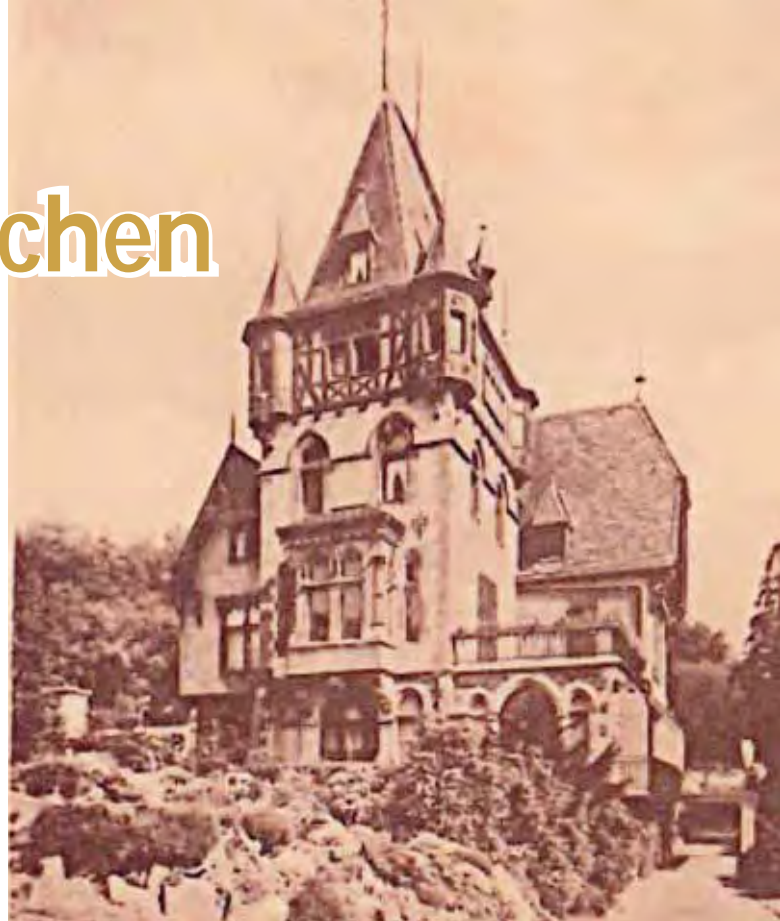
Diese Aufnahme zeigt das Haus Heisterberg, sie entstand etwa 1930

So hätte es immer weitergehen können. Aber in Frankreich brach die Revolution aus. Ein gewisser Napoleon Bonaparte stieg in der Armee auf, wurde General, Erster Konsul und schließlich Kaiser. Im