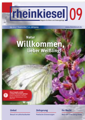
Titelbild Ulrich Sander

Erscheinungsweise monatlich jeweils zum Monatsbeginn