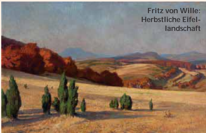
Fritz von Wille: Herbstliche Eifel- landschaft

Siebengebirgsmuseum Königswinter | Sonderausstellung Rheinische Landschaften im 20. Jahrhundert bis 22. April 2018